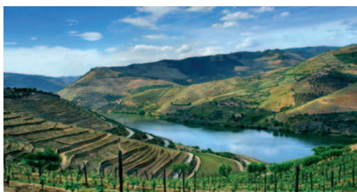
paysage du Douro (DOC)

C'est une appellation DOC dont les vins sont produits dans le terroir viticole de la vallée du Douro, qui couvre les sous-régions de Baixo Corgo, Cima Corgo et Haut Douro, au Nord du pays, des deux côtés des berges du Douro. Ce terroir est le même que celui qui produit les vins de Porto.