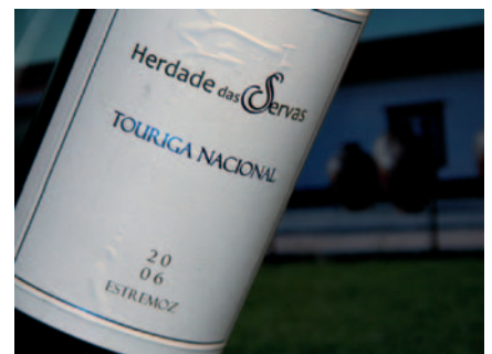
▲ Un aperçu vinicole des vins portugais à travers quelques DOC

La réussite de la viticulture portugaise repose sur ses cépages autochtones. 60 % des vins produits sont rouges. Les cépages rencontrés dans le Douro principalement sont le Touriga Nacional, le Touriga Francesa, le Tinta Barroca, le Tinta Amarela, le Tinta Roriz (Tempranillo espagnol). Les variétés internationales comme la Syrah et le Cabernet Sauvignon commencent à faire leur apparition. Les variétés blanches les plus répandues sont l'Alvarinho (Vinho Verde), la Malvasia, et des variétés de Muscat.